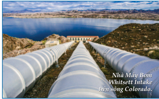
Nhà Máy Bơm Whitsett Intake trên sông Colorado.