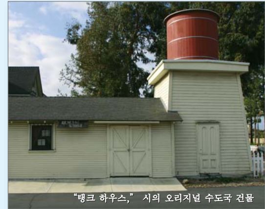
“탱크 하우스,” 시의 오리저널 수도국 건물

때로는, 귀하의 수돗물에 함유된 질산염이 최대허용기준 (MCL)의 반을 초과할 수 있으나, 리터 당 45 밀리그램 (mg/L) 을 초과한 적은 없습니다. 귀하의 식수내 2010년내 질산염에