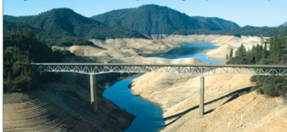
Lago Oroville (2011)